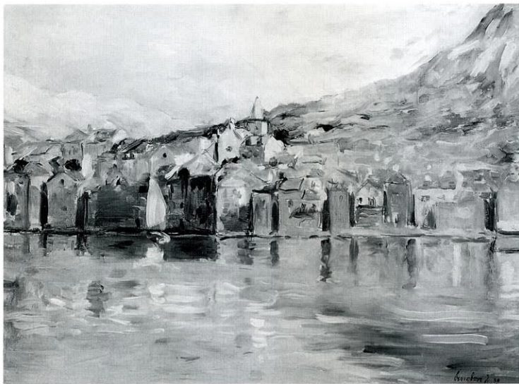
20. BAŠKA, 1939.