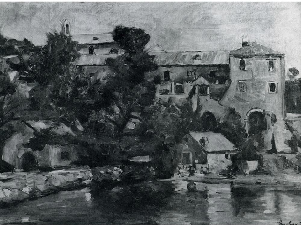
19. SV. EUFEMIJA NA RABU, 1939.