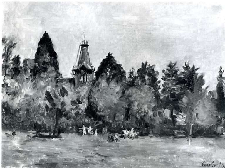
18. VILA U TUŠKANCU, 1939.