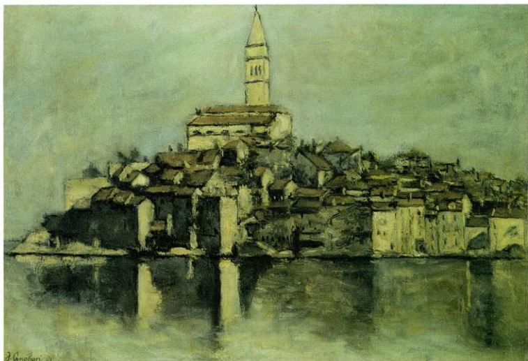
50. ROVINJ, 1945.