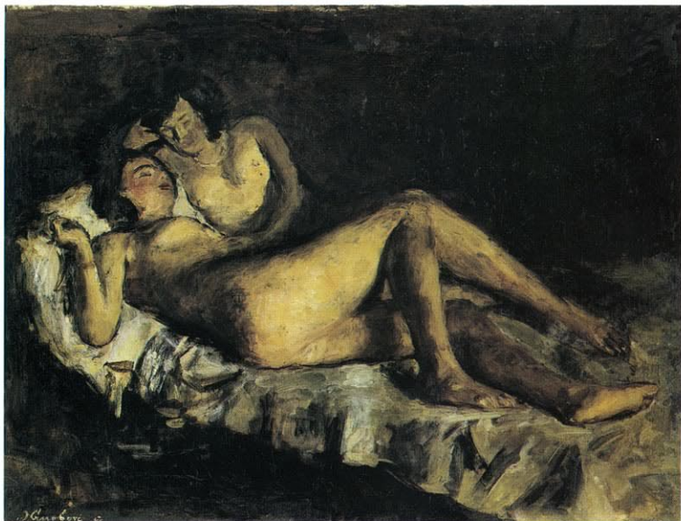
40. PRIJATELJICE, 1943.