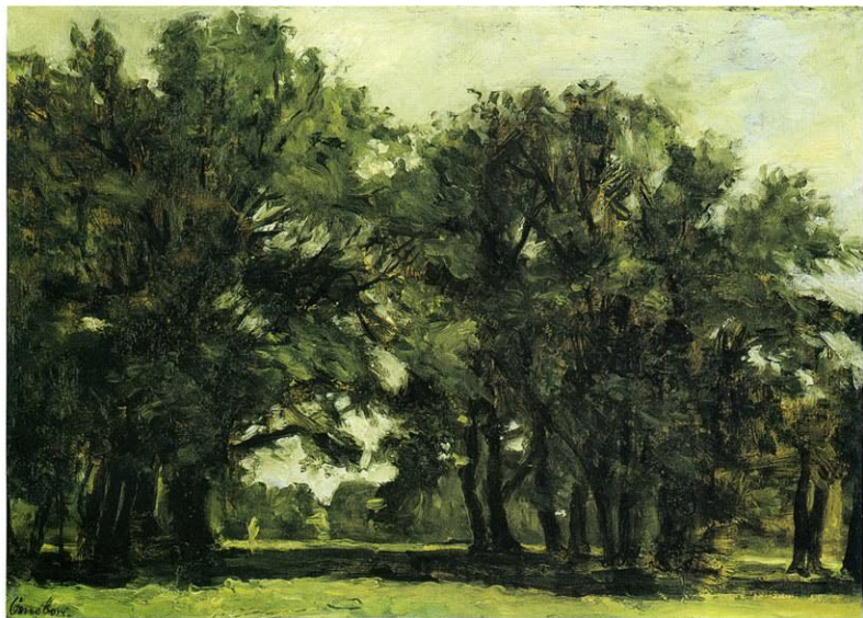
37. ŠUMA, 1943.